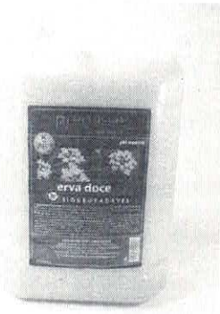
( https://images-americanas.b2w.io/produtos/01/00/sku/20543/8/20543825_1SZ.jpg )