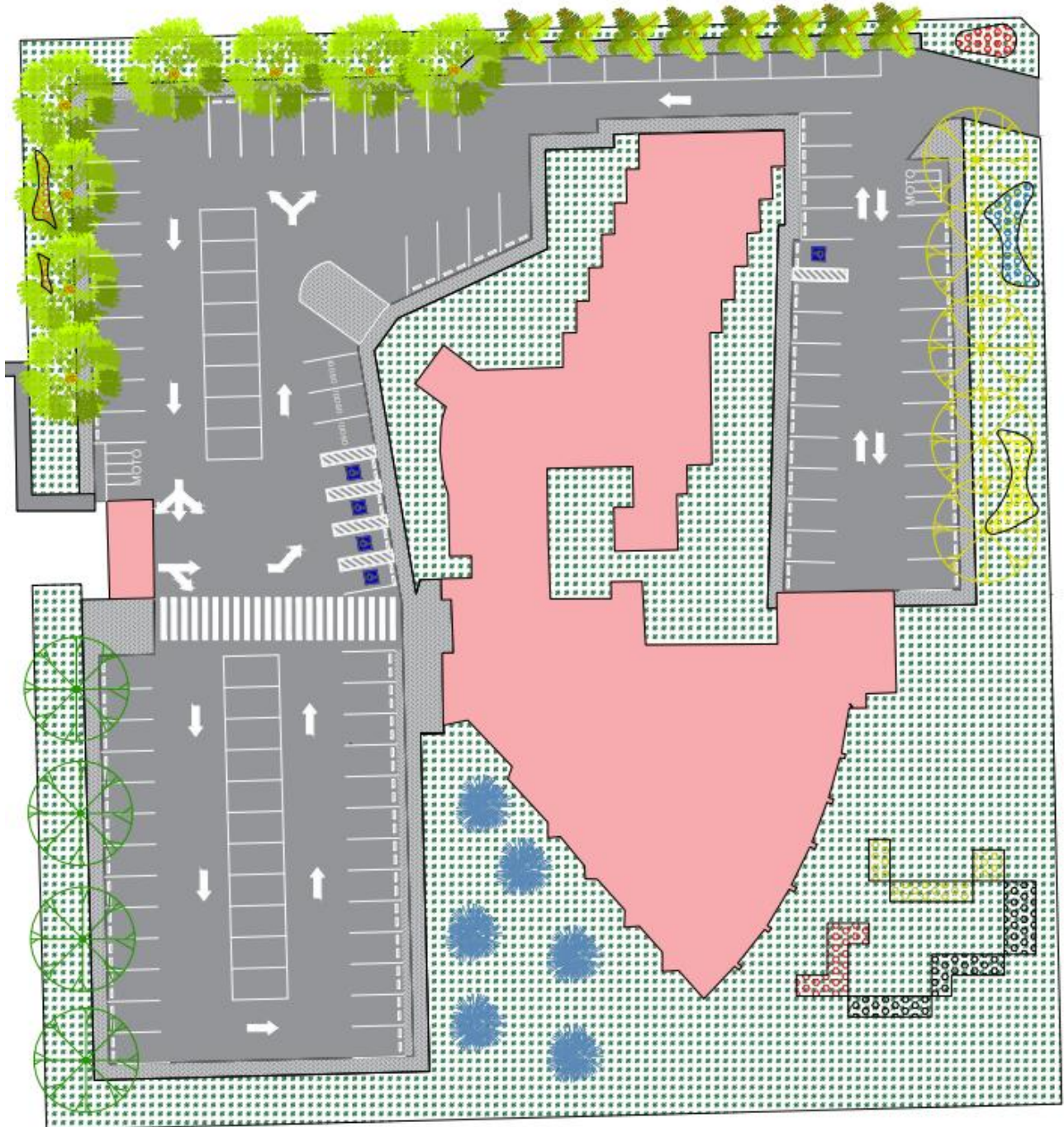
ILUSTRAÇÃO VAGAS DE ESTACIONAMENTO